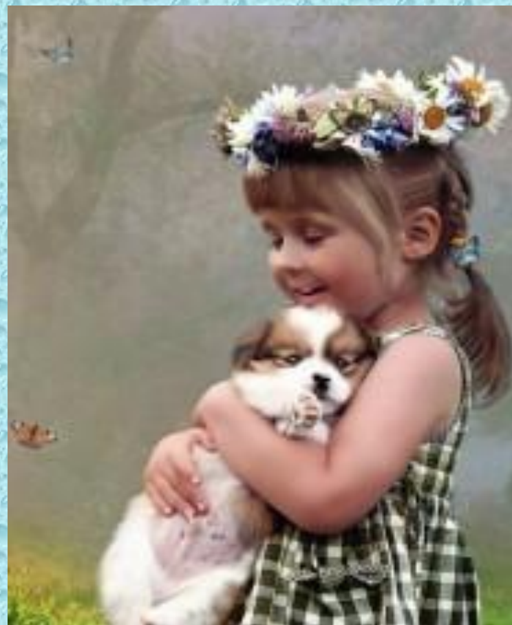
Девочка держит Шарика.