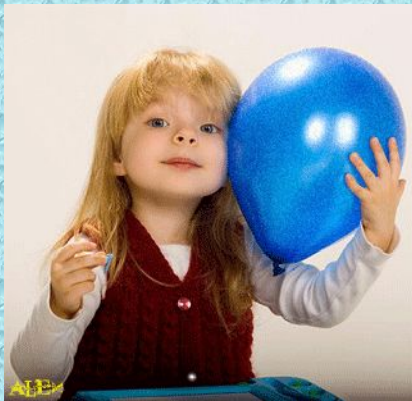
Девочка держит шарик.