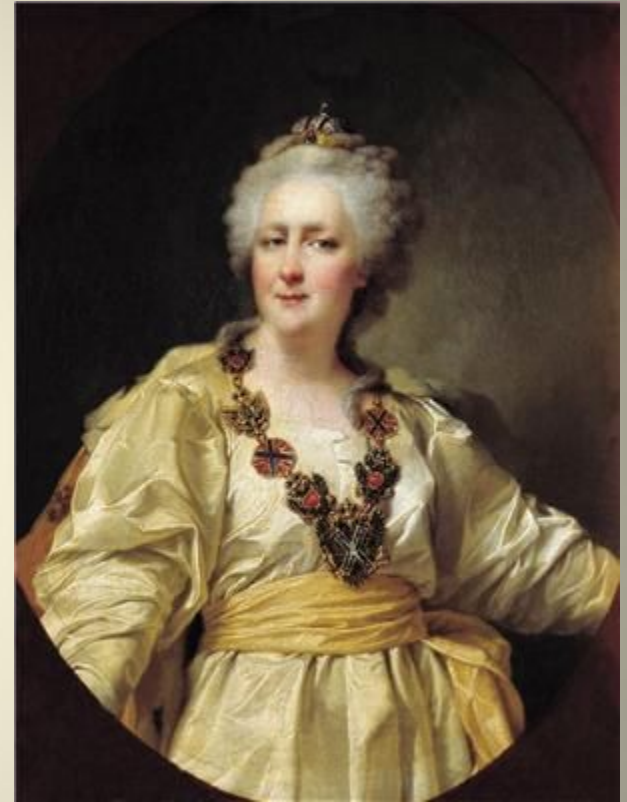
Императрица Екатерина Вторая

Таврический дворец был построен по указанию Екатерины II для своего фаворита, светлейшего князя Г. А. Потёмкина. На возведение и отделку дворца было затрачено около 400 000 рублей золотом. Дворец получил своё название по его титулу Князь Таврический, который был пожалован ему в 1787 году, после присоединения к Российской империи Крыма (Таврии). От названия Таврического дворца происходят наименования Таврического сада, Таврической