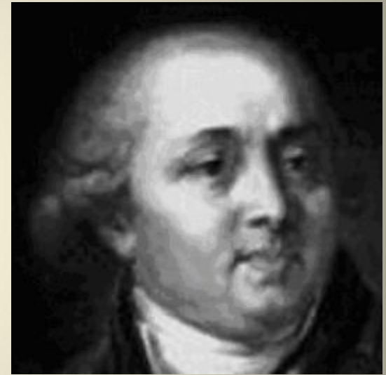
СТАРОВ Иван Егорович русский архитектор