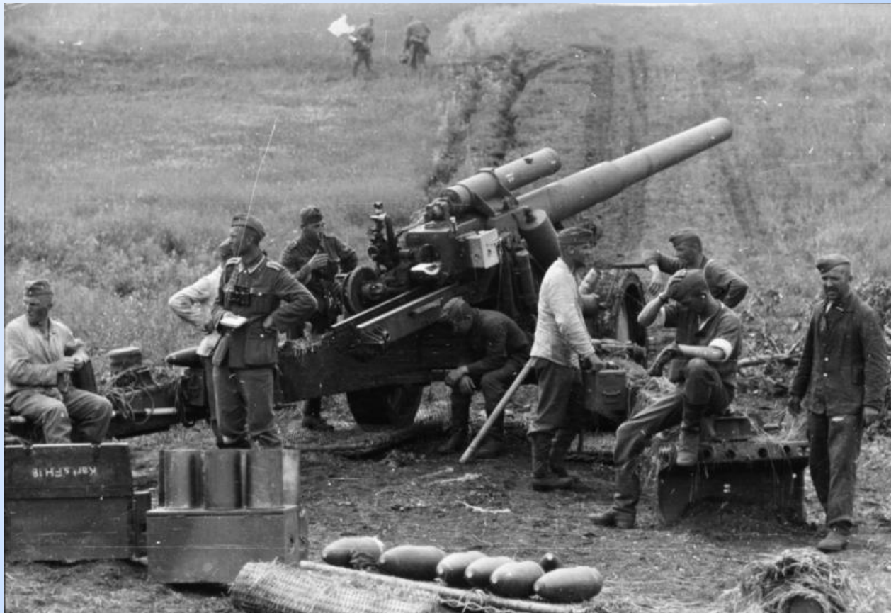
1942 Sommer

В число задач войск охраны тыла входило: наведение в войсковом тылу порядка, регулирование движения беженцев по дорогам, задержание дезертиров, выявление диверсантов и шпионов и борьба с ними, регулирование подвоза и эвакуации имущества и др.