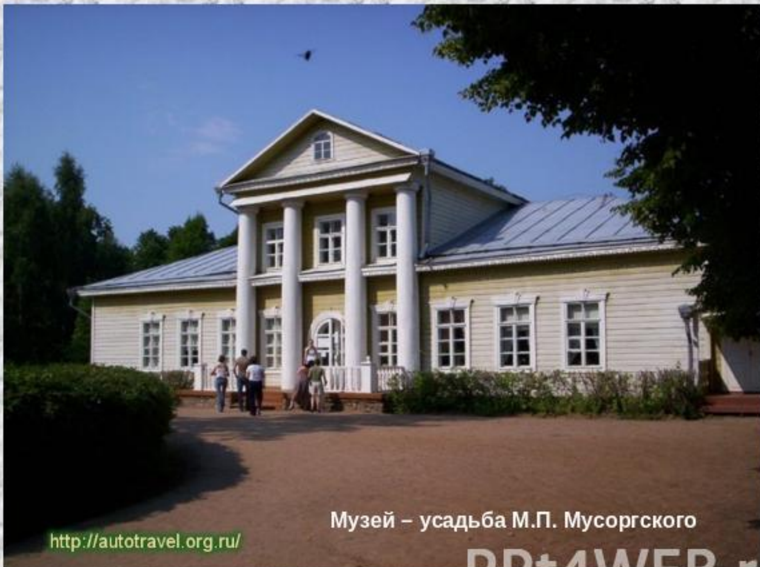
Музей – усадьба М.П. Мусоргского