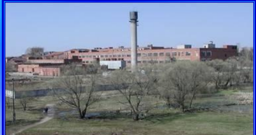
Тейковский ХБК (бывшая фабрика)