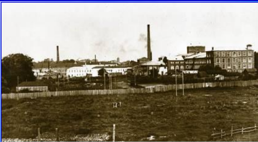
Фабрика Каретникова (фото XIX века)