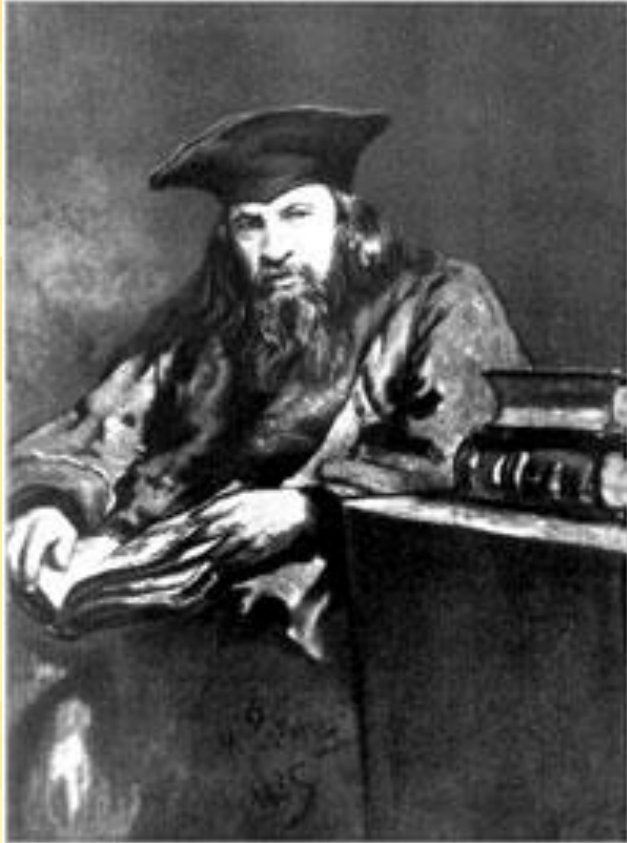
Д. И. Менделеев в мантии магистра наук.