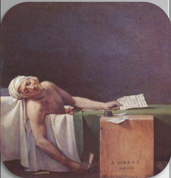
Давид «Смерть Марата»