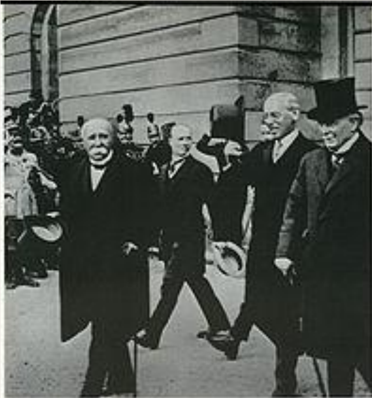
Клемансо, Вильсон, Ллойд Джордж. После подписания Версальского мира (1919г)

Второй срок его президентства был отмечен вступлением США в первую Мировую войну и активными дипломатическими усилиями Вильсона по мирному урегулированию. Вильсон стал первым президентом США, посетившим с официальным визитом Европу (для участия в работе Парижской мирной конференции). Его предложения были положены в основу Версальского договора. Вильсон был одним из инициаторов создания Лиги Наций, но Сенат отказал во вступлении и в эту организацию.