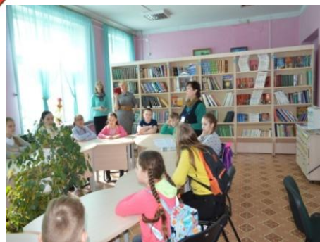
Үзәк балалар китапханәсе