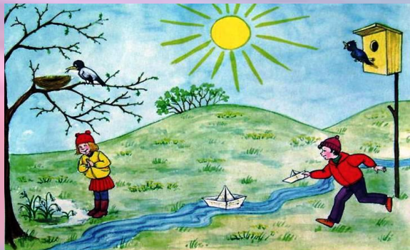
Ивкина Лиза, 4в

Бөгелмә шәһәре Татарстан Республикасы муниципаль гомуми белем бирү учреждениесе аерым фәннәрне тирәнтен өйрәнүче бнчы урта гомуми белем бирү мәктәбе