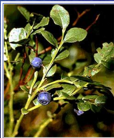
го л убика