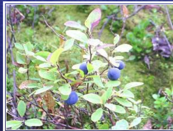
че р ника