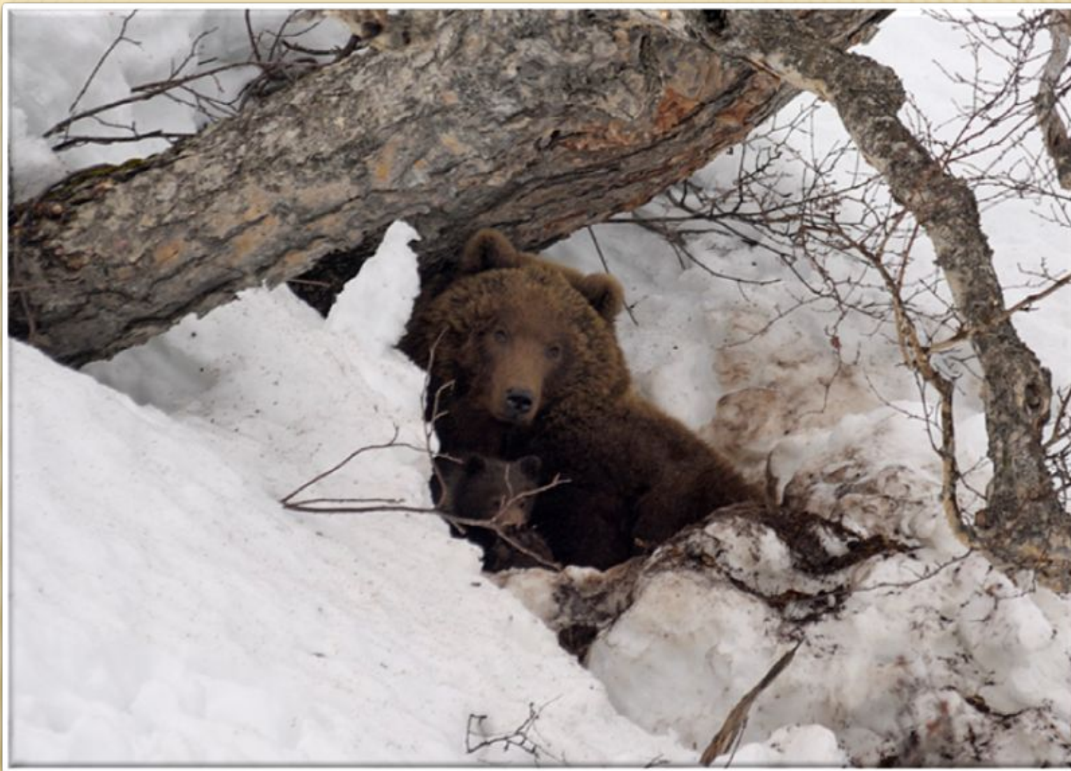
Просыпается в берлоге медведь