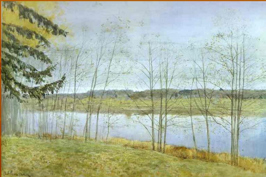
Осень. Исаак Левитан