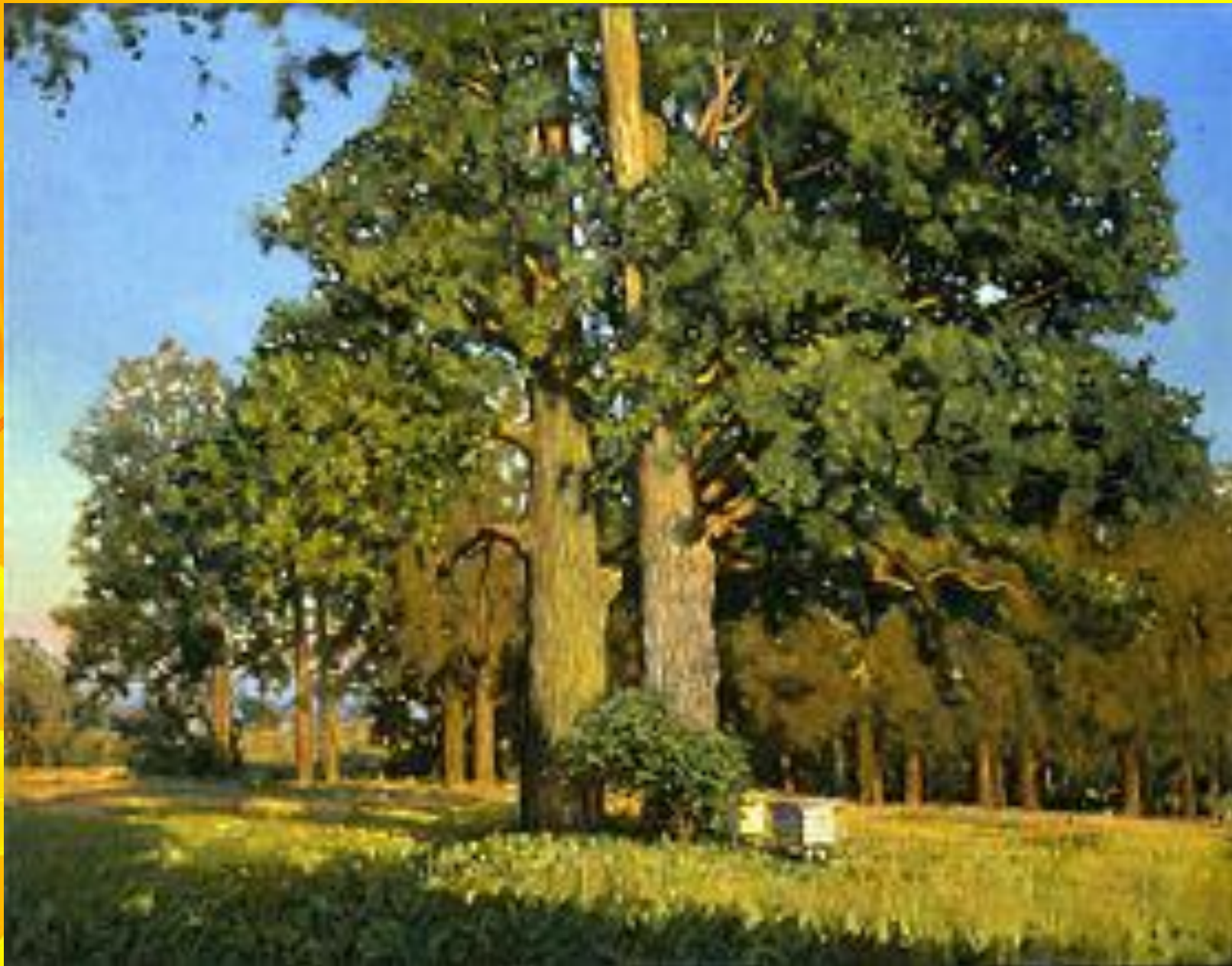
«Старые дубы», Николай Анохин, 1999 год.