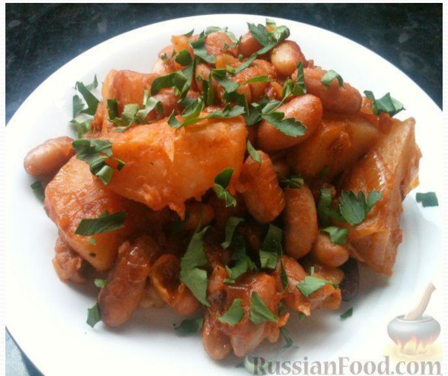
Рагу из фасоли с картофелем