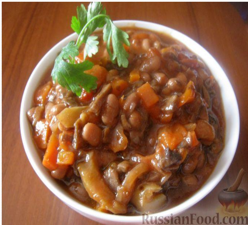
Фасоль тушеная с грибами