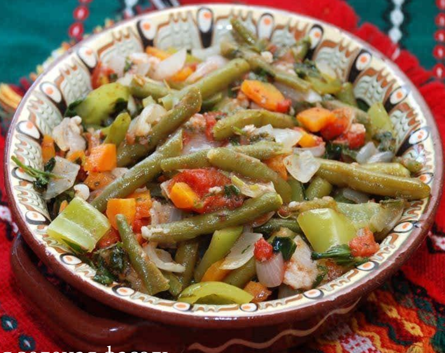
Тушеная зеленая фасоль