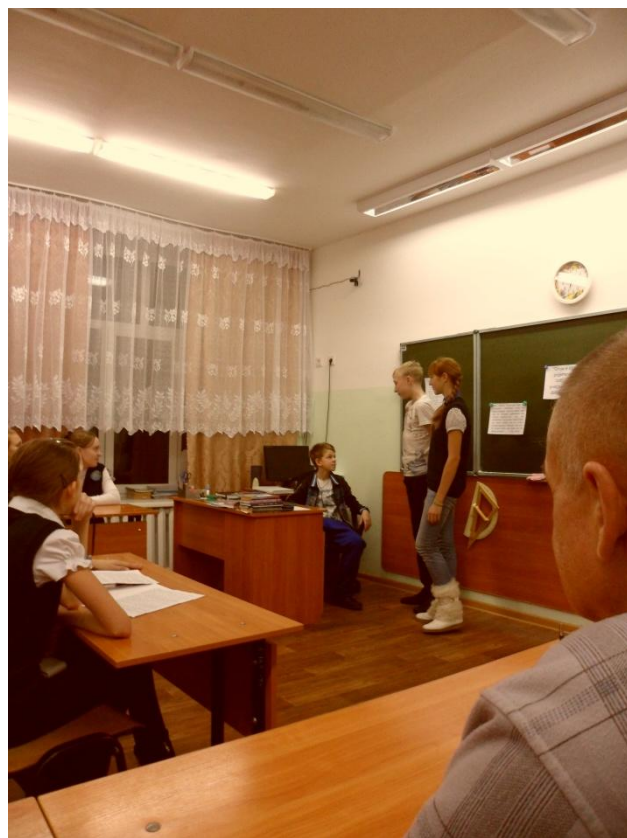
Сценка «В школу»