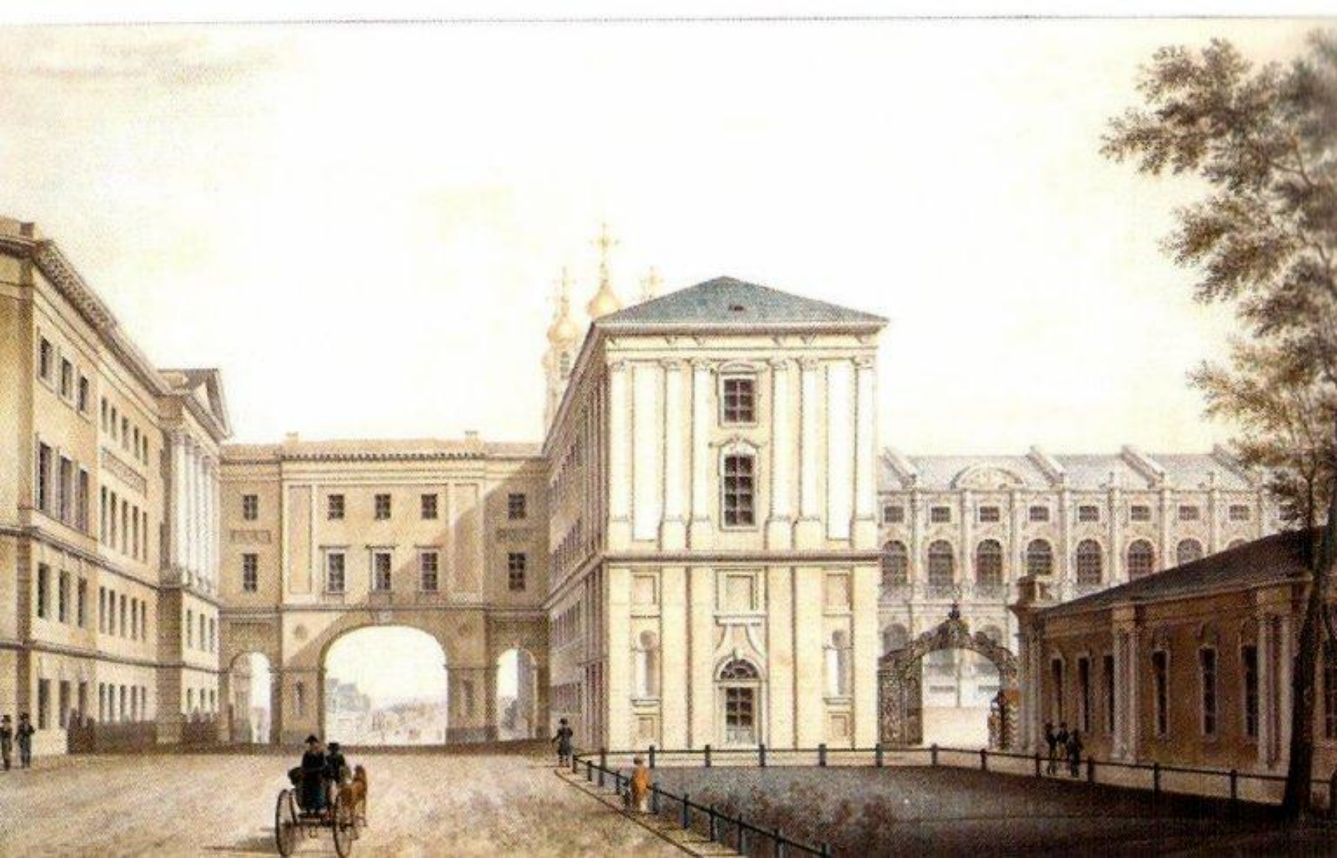
Царскосельский лицей во времена Пушкина