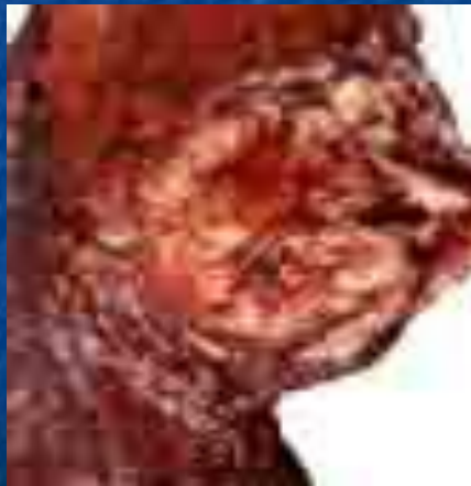
После 5 лет курения