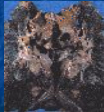
После 25 лет курения