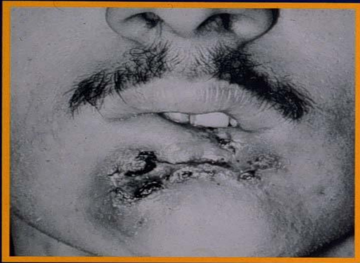
A fatal mouth cancer in a 28-year-old who dipped a can a day for 10 years.

Рак ротовой полости у 28-летнего курильщика с 10-летним стажем