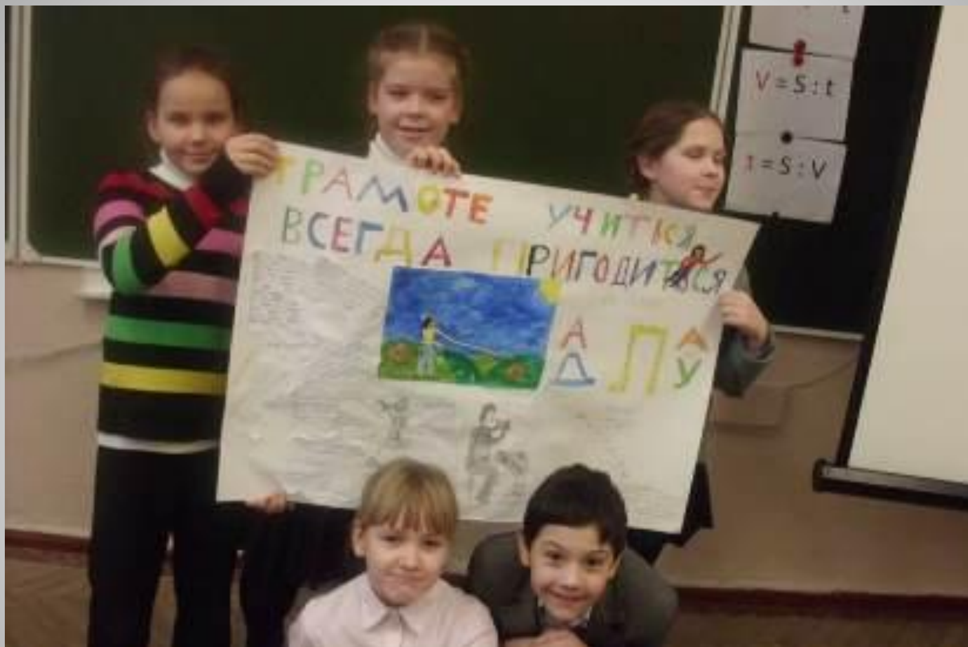
Стенная газета учеников 4-6 класса.