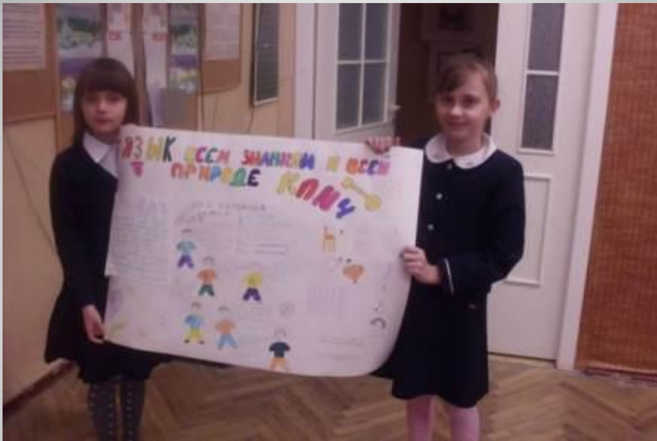
Стенная газета 3-б класса.