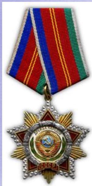
Орден Дружбы народов (22 апреля 1994 года)