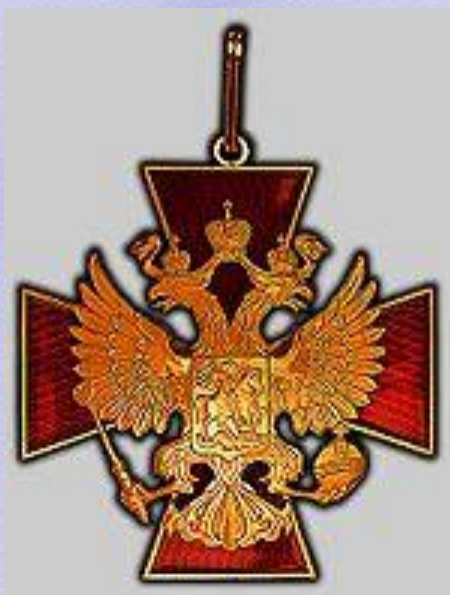
Орден «За заслуги перед Отечеством» III степени (16 апреля 1997 года)