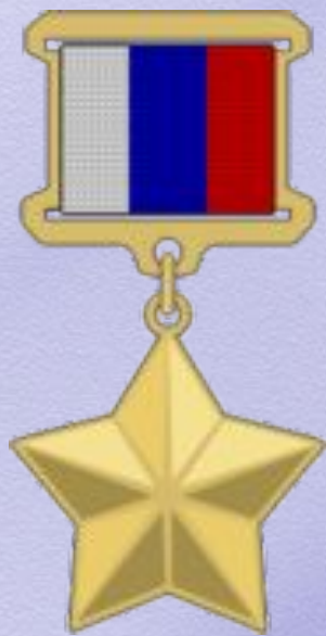
Герой Российской Федерации (27 февраля 1998 года)