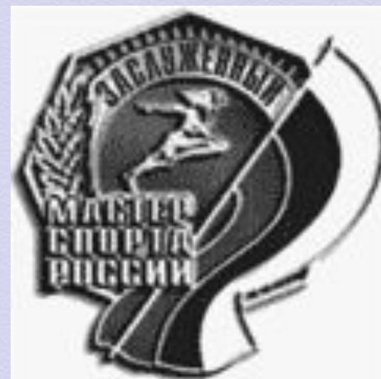
Заслуженный мастер спорта России (1992)