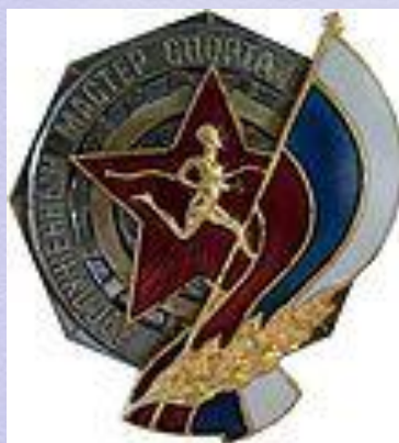
Заслуженный мастер спорта