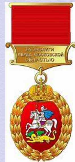
Знак отличия «За заслуги перед Московской областью» (15 декабря 2008 года)