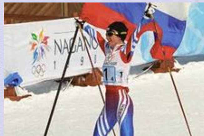
Заслуженный мастер спорта после 2007 г