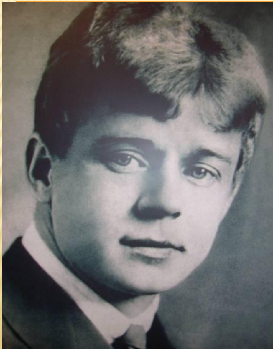
Сергей ЕСЕНИН 1895-192 5