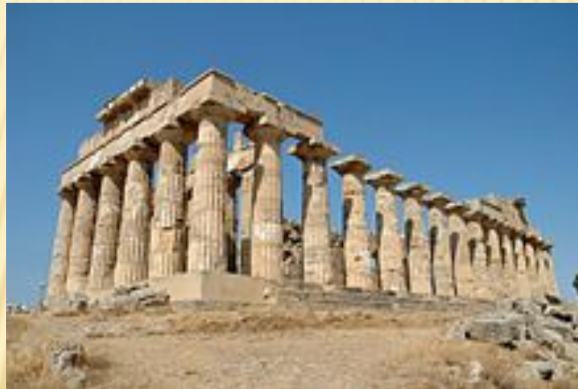
Греческий храм на Сицилии, посвященный Гере, построен в 5-м столетии до н. э.

Архитектура непременно создает материально организованную среду, необходимую людям для их жизни и деятельности, в соответствии с современными техническими возможностями и эстетическими воззрениями общества