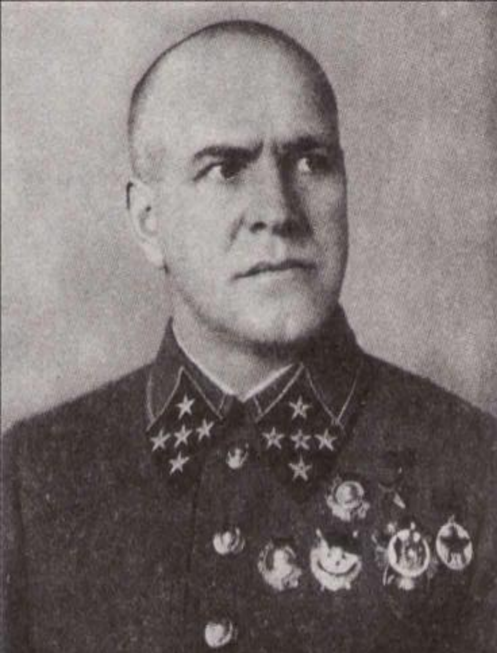
Георгий Константинович Жуков