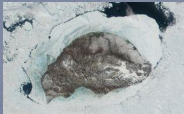
Снимок из космоса