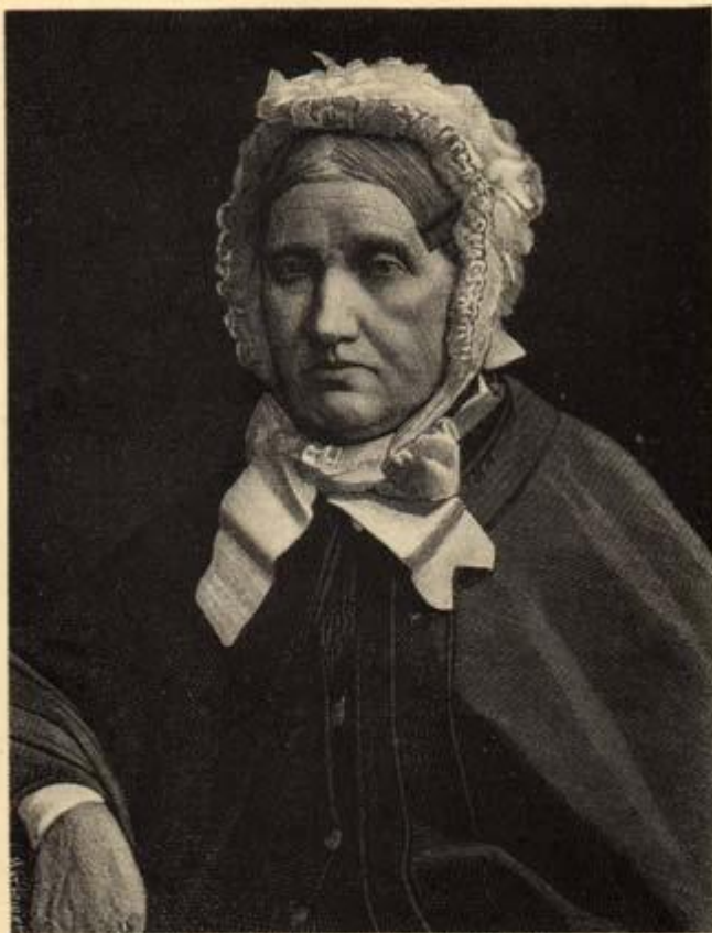
Александра Осиповна Ишимова 1804—1881.