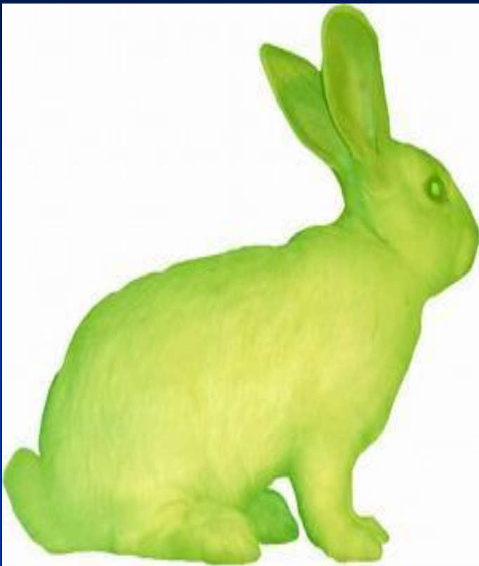
Флуоресцентный кролик, выведенный методом генной инженерии