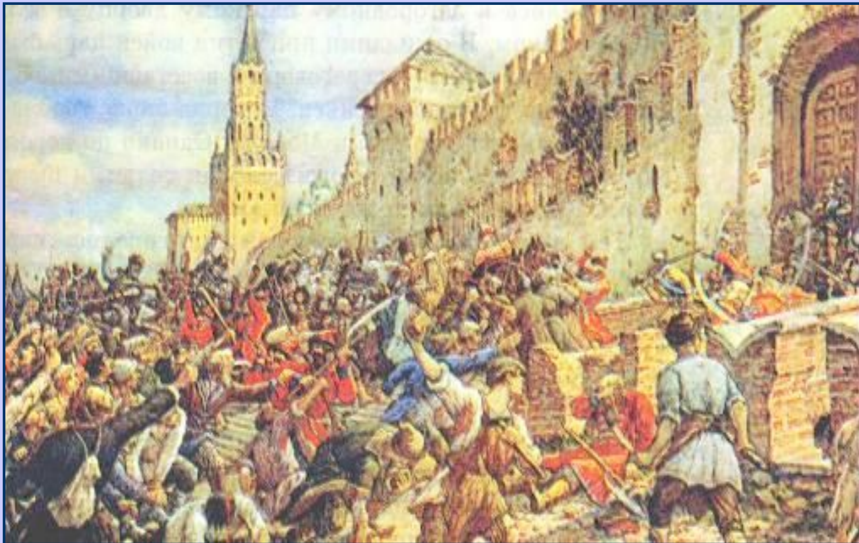
Соляной бунт 1648г.