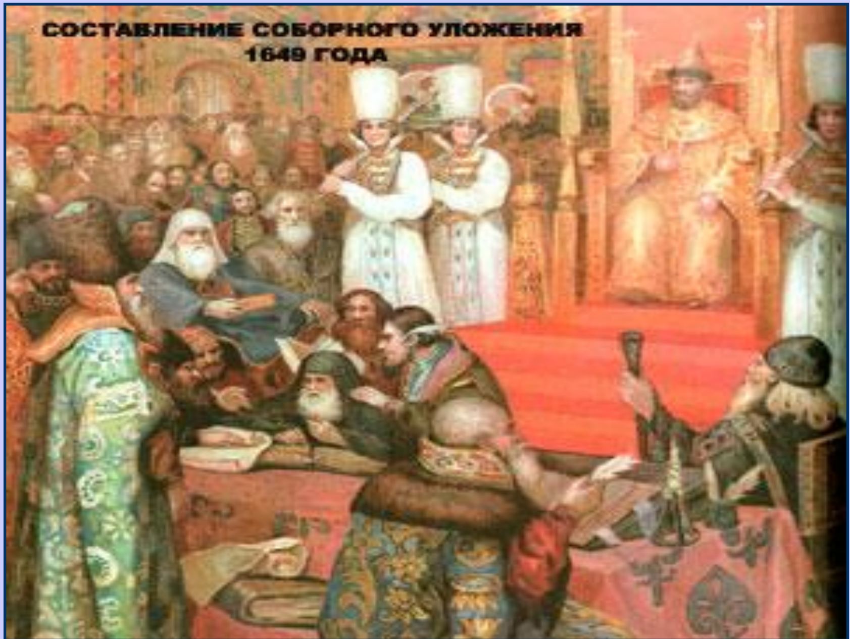
Земский собор 1648-1649 гг.