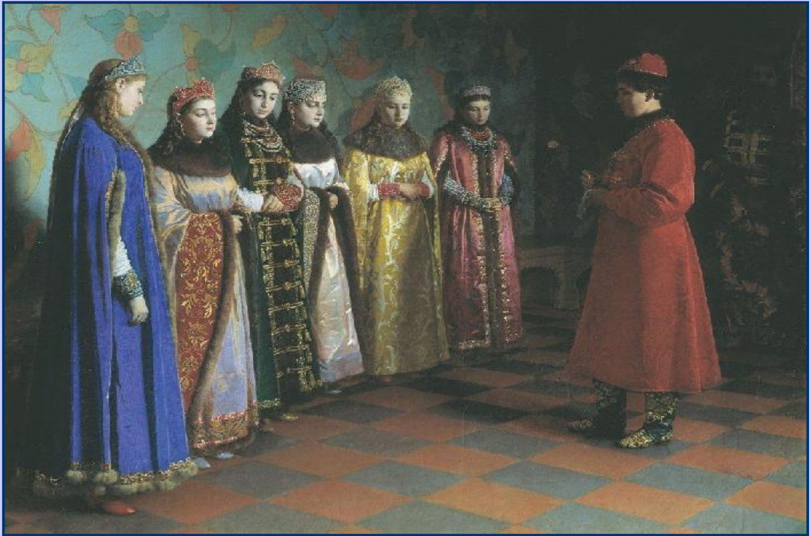
Выбор невесты царем Алексеем Михайловичем.