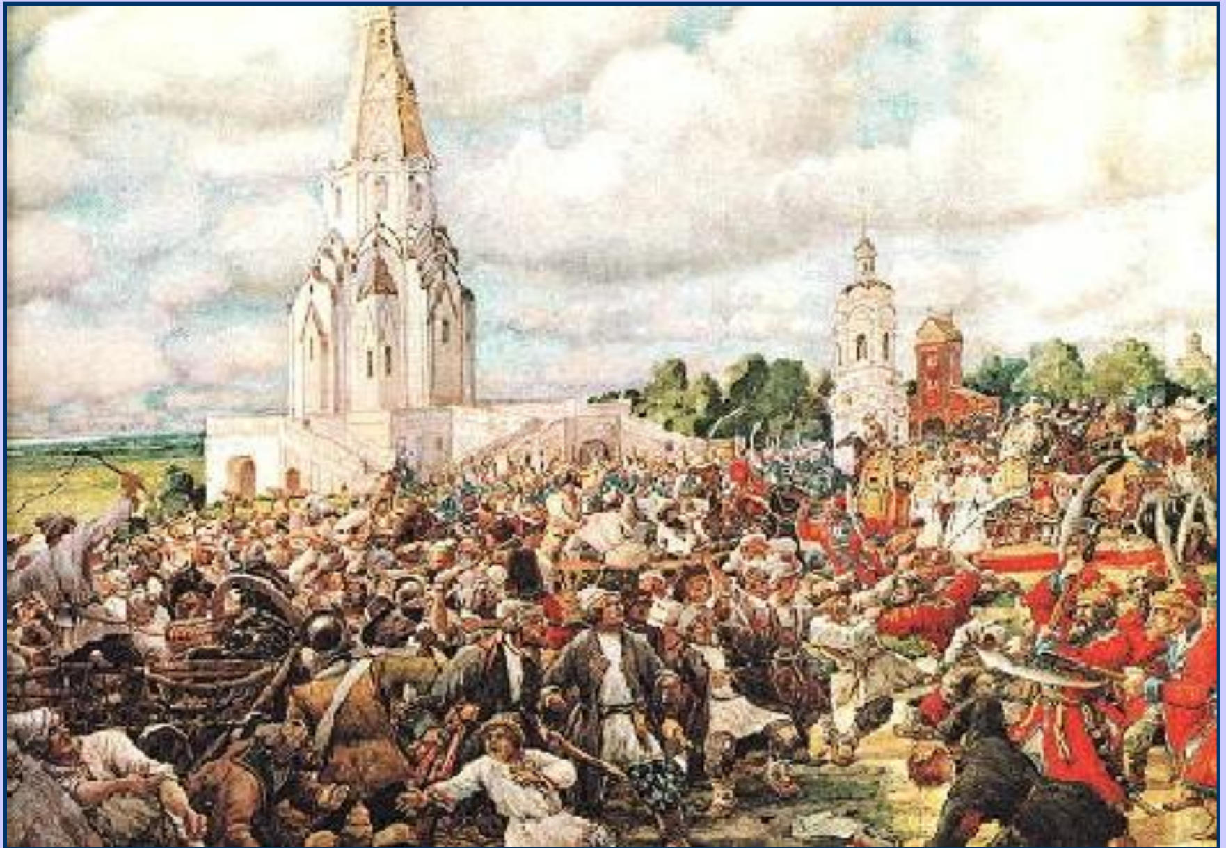
Медный бунт 1662 г.