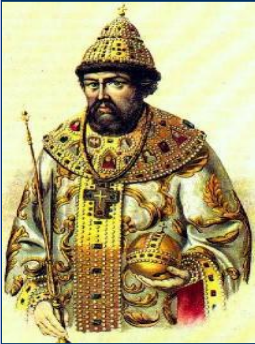
Алексей Михайлович Романов