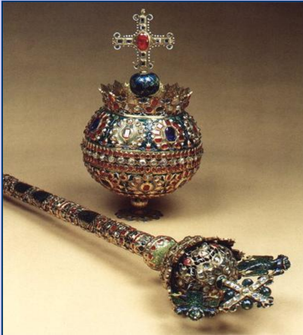
Скипетр и держава царя Алексея Михайловича Романова.