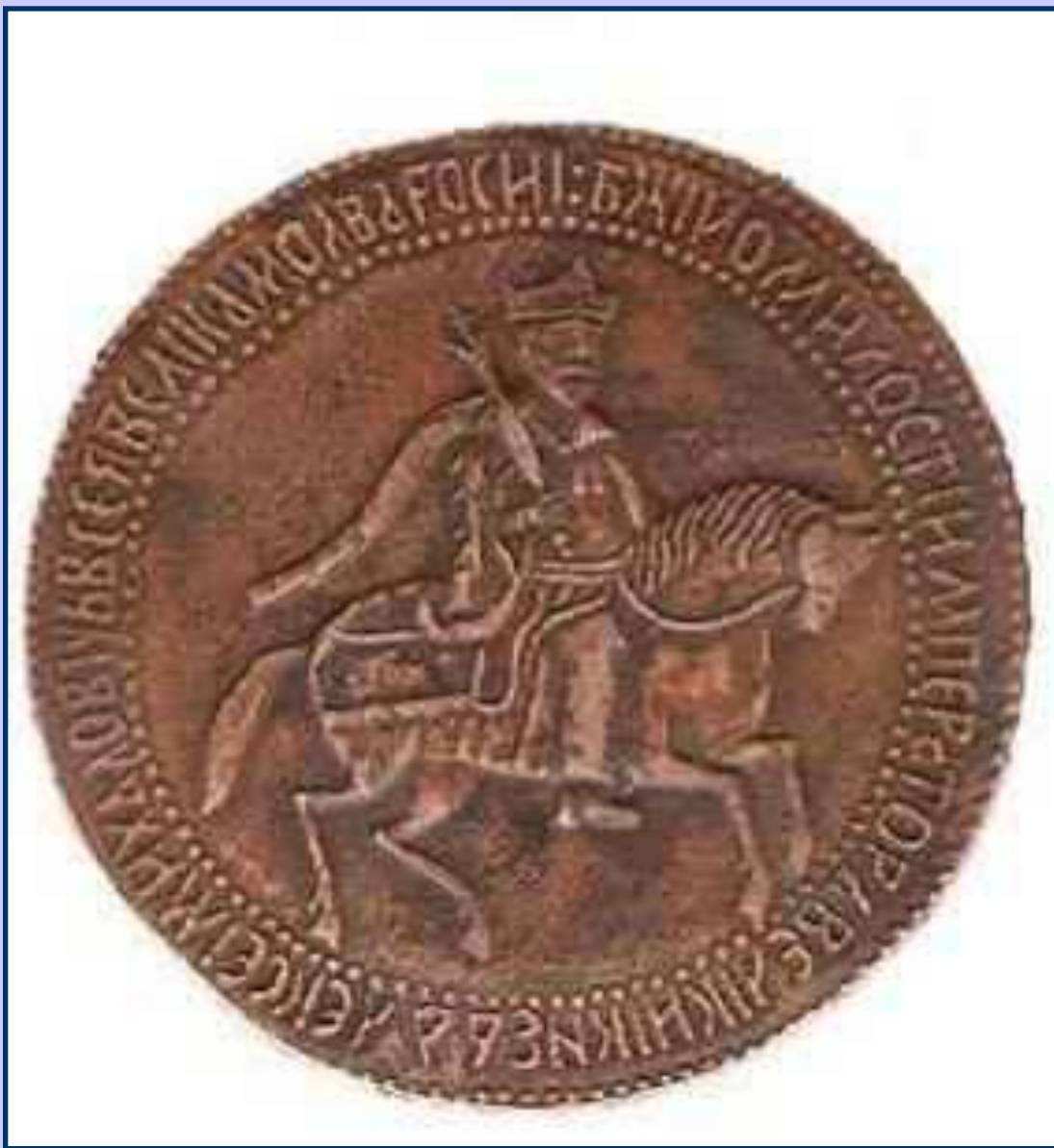
Медный рубль 1655-1663гг.