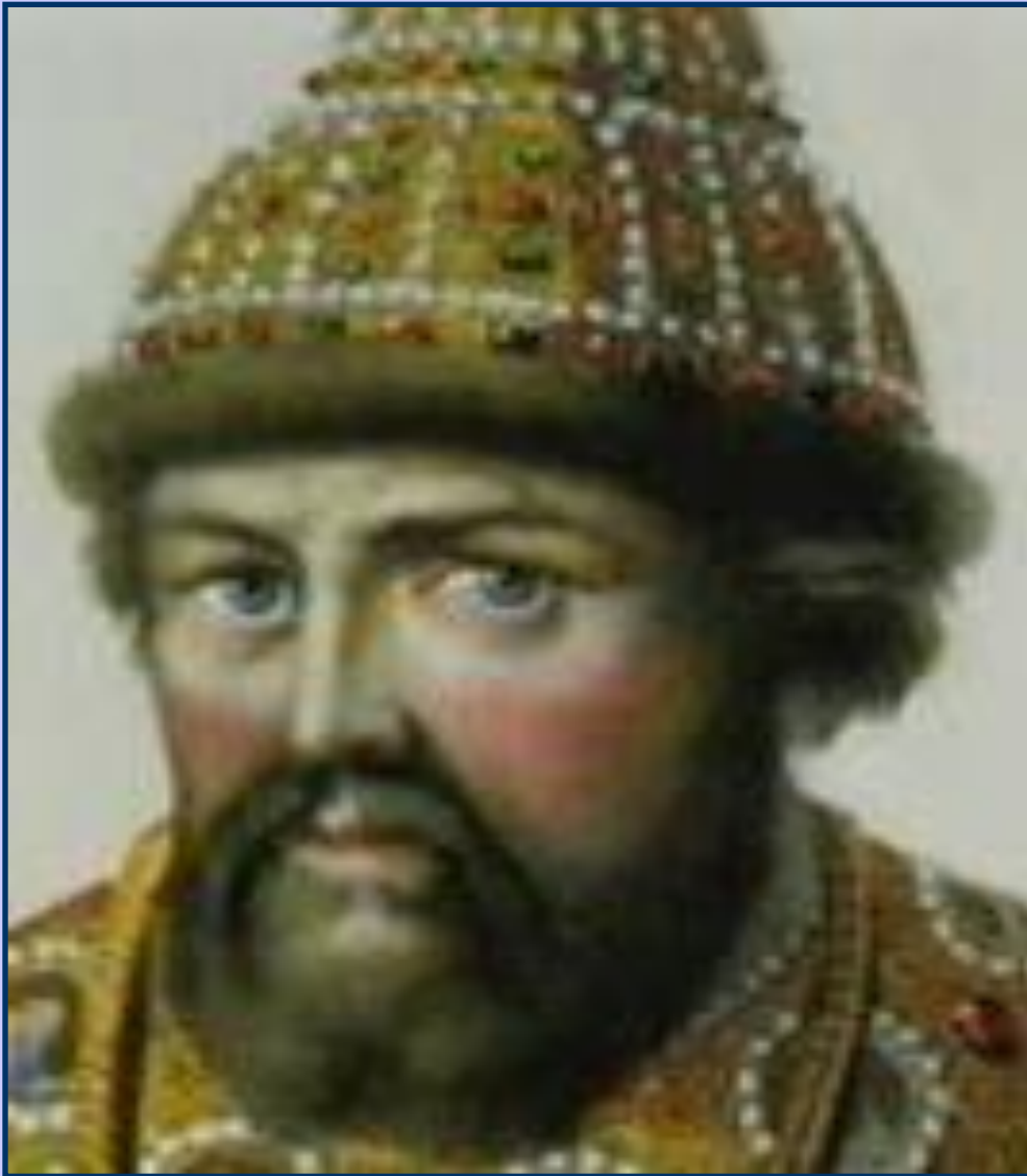
Царь Алексей Михайлович Романов (годы правления 1645-1676)