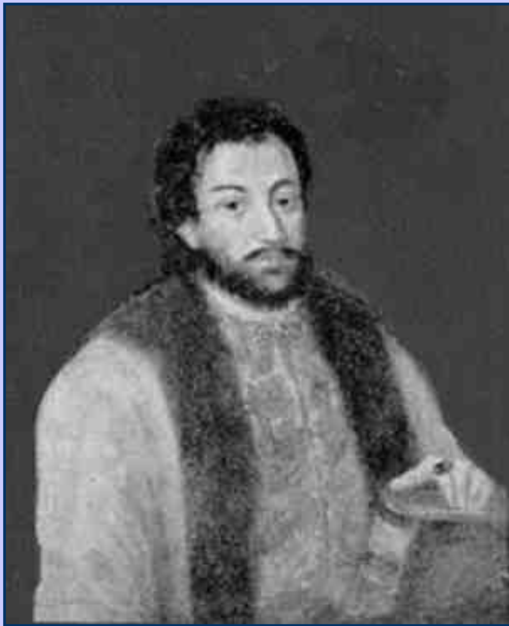
князь Н.И. Одоевский