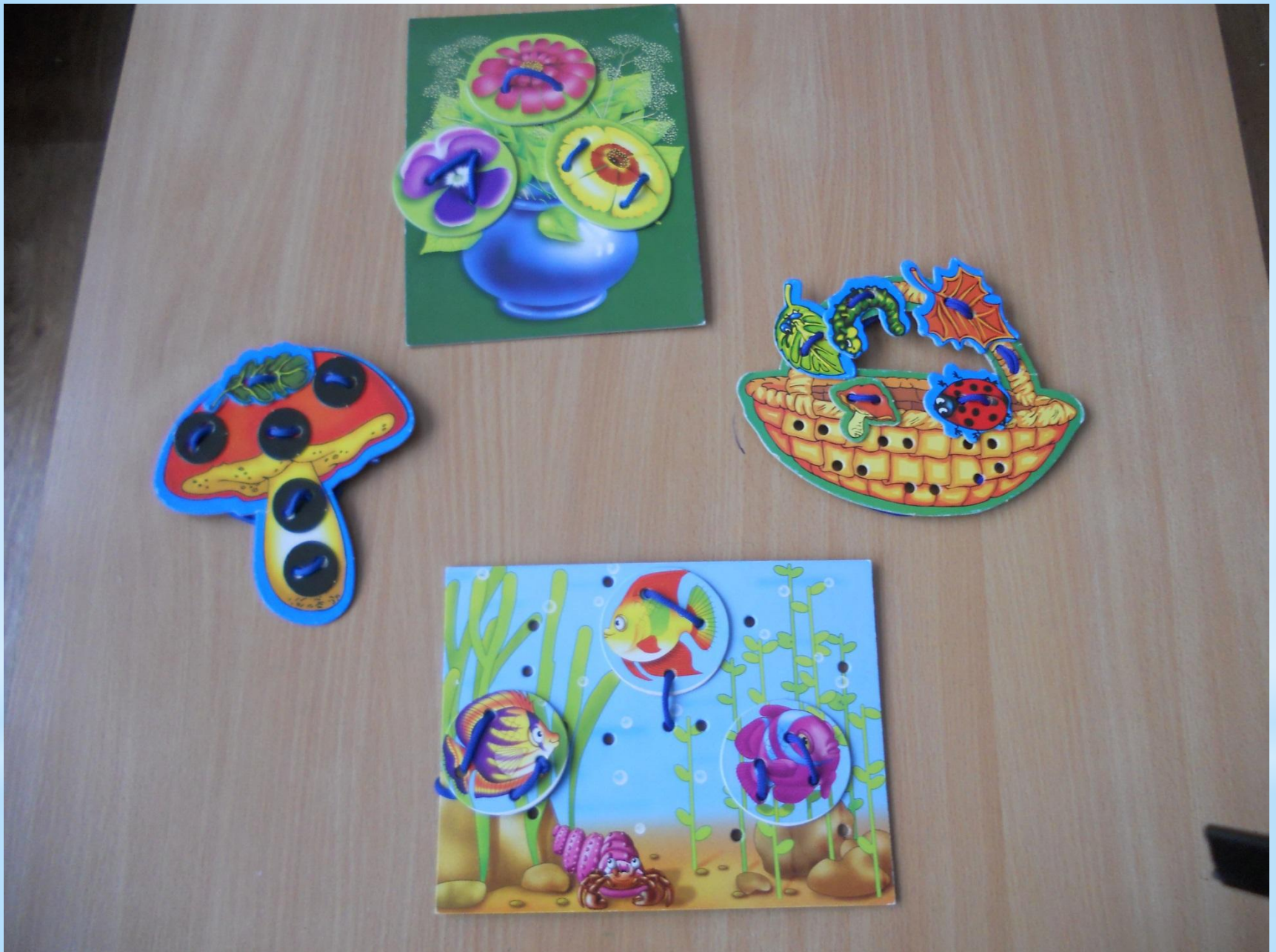
Игры на развитие мелкой моторики «Шнурочки».