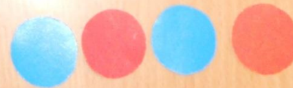
Пеналы для составления схемы слова.