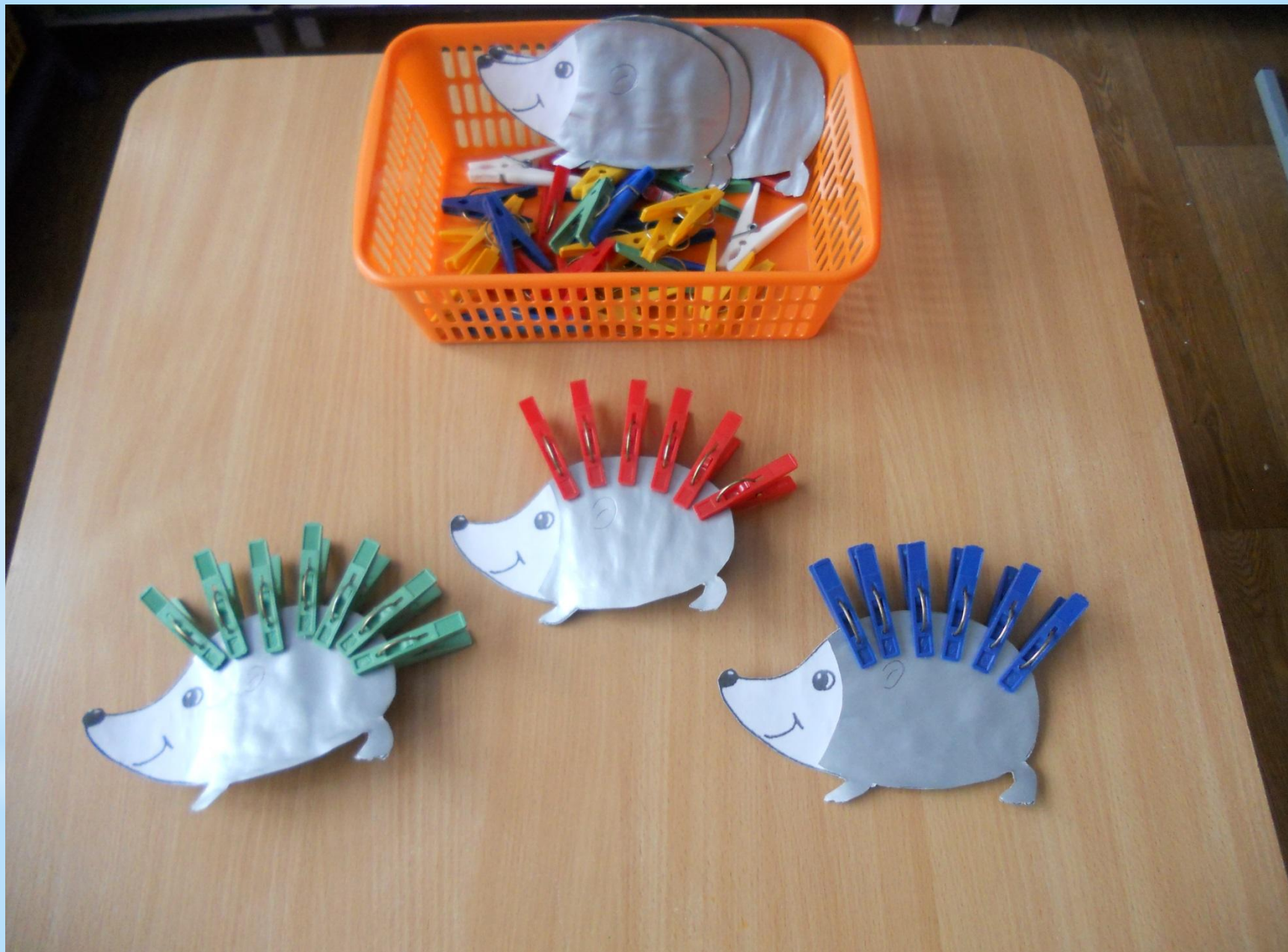
Игры на развитие мелкой моторики.