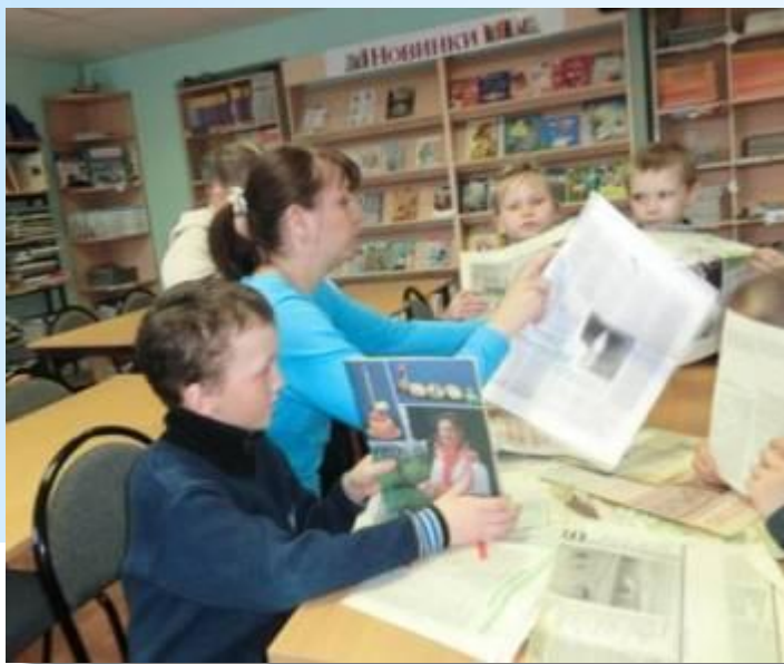
Знакомство с литературой о пасхе