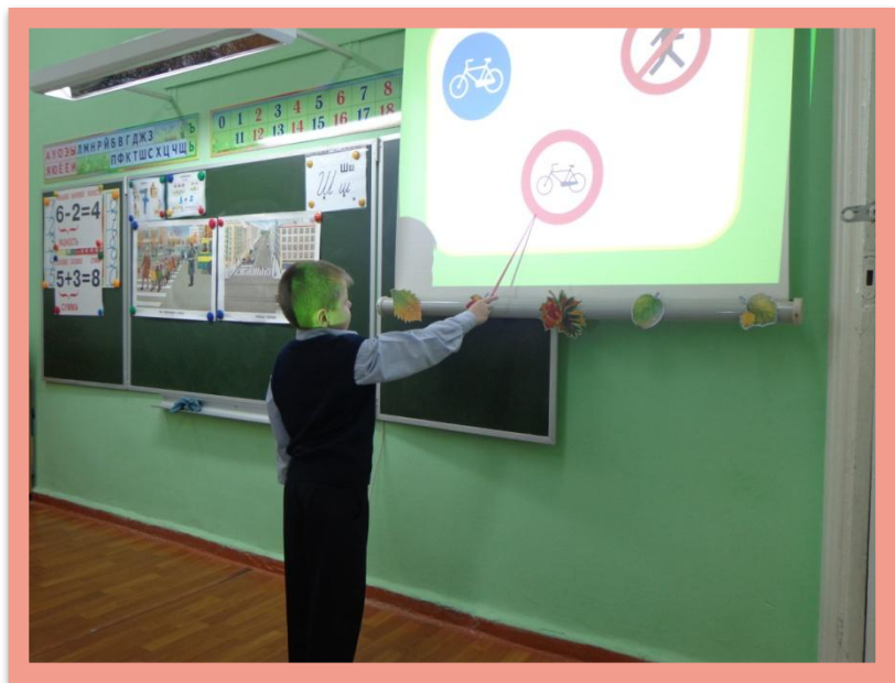
Движение на велосипедах запрещено