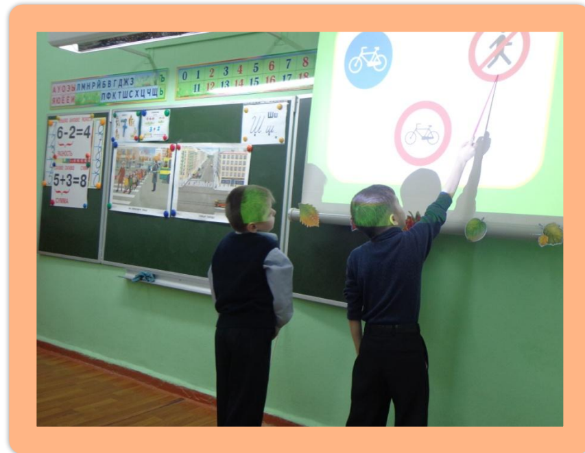
Движение пешеходов запрещено