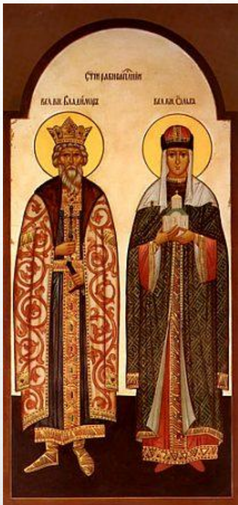
Равноапостольные князь Владимир и княгиня Ольга

. Владимир был внук святой равноапостольной Ольги, сын Святослава († 972). Мать его, Малуша († 1001) - дочь Малка Любечанина, которого историки отождествляют с Малом, князем Древлянским. Приводя к покорности восставших древлян и овладев их городами, княгиня Ольга повелела казнить князя Мала, за которого пытались ее сватать после убийства Игоря, а детей его, Добрыню и Малушу, взяла с собой. Добрыня вырос храбрым умелым воином, обладал государственным умом, был впоследствии хорошим помощником своему племяннику Владимиру в делах военного и государственного управления .