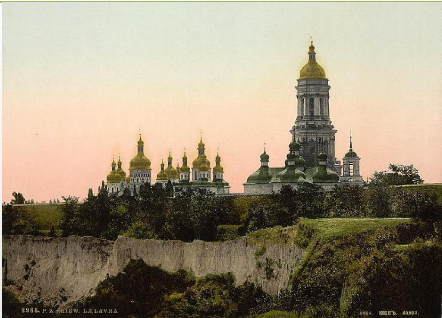
Киево-Печерская Лавра. ОКОЛО 1890 Г., раскрашенная литография.