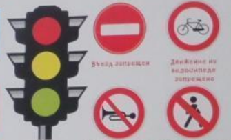
Въезд запрещен Движение на велосипеде запрещено Подъезд звукового сигнала запрещен Движение пешеходов запрещено