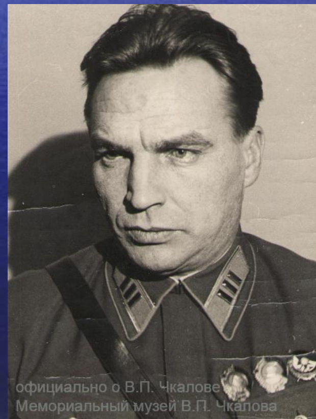
официально о В.П. Чкалове Мемориальный музей В.П. Чкалова

Советский летчик, Герой Советского Союза (1936), комбриг ВВС СССР (1938). Родился 20 января (2 февраля) 1904 года в селе Василево Балахнинского уезда Нижегородской губернии (ныне город Чкаловск, райцентр Нижегородской области). Жил в селе до 1916 года и в 1918-1919 годах, неоднократно приезжал сюда позднее. В 1937 году по просьбе жителей поселка Василево он был переименован в Чкаловск.