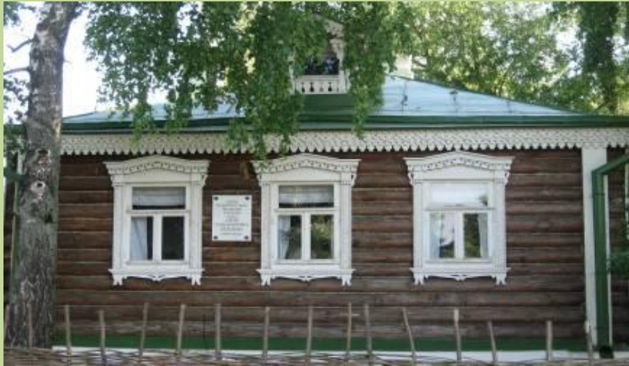
Дом родителей Есенина

Сергей Есенин родился 3 октября 1895 года в селе Константиново.