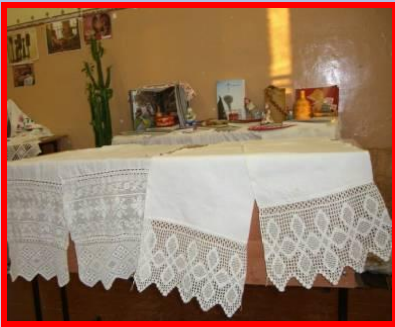
Фото из этнографического уголка кабинета русского языка и литературы МОУ «СОШ №23»