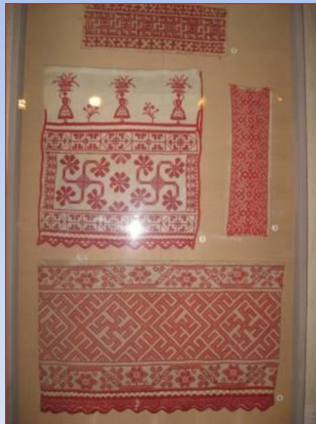
Фото. Музей народной культуры, Тарнога, Вологодская область