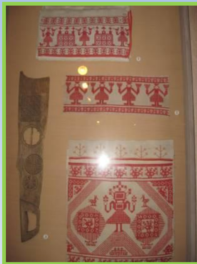
Фото. Музей народной культуры. Тарногский Городок, Вологодская область