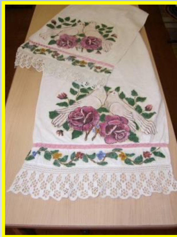
Рушник привезён из Тарногского района Вологодской области (30-е годы 20-го века)