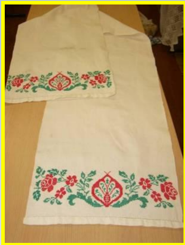
Рушник многоцелевого назначения Каргополье, середина 20-го века