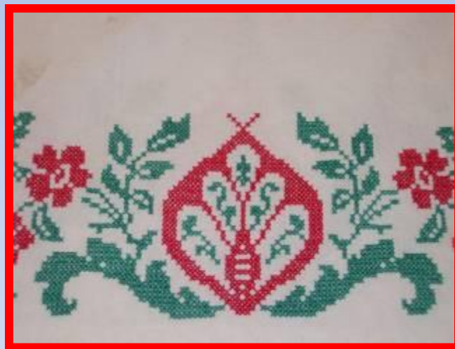
Растительный орнамент на рушнике Каргополя