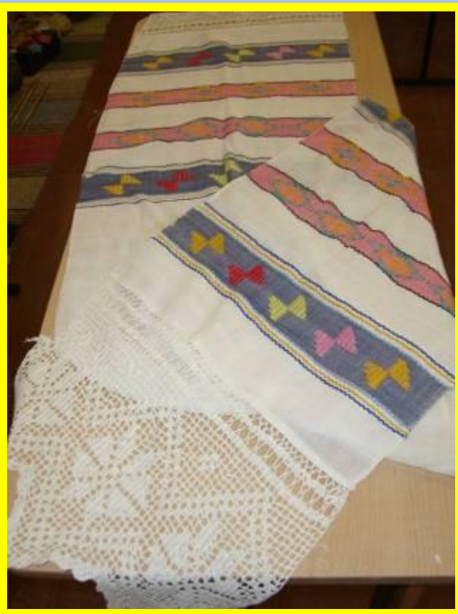
Рушник привезён из Плесецкого района Архангельской области (середина 20-го века)