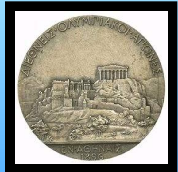
Серебряная медаль чемпиона Игр I Олимпиады