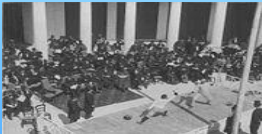
Один из поединков

9 апреля в соревнованиях саблистов победил грек Иоаннис Георгиадас.