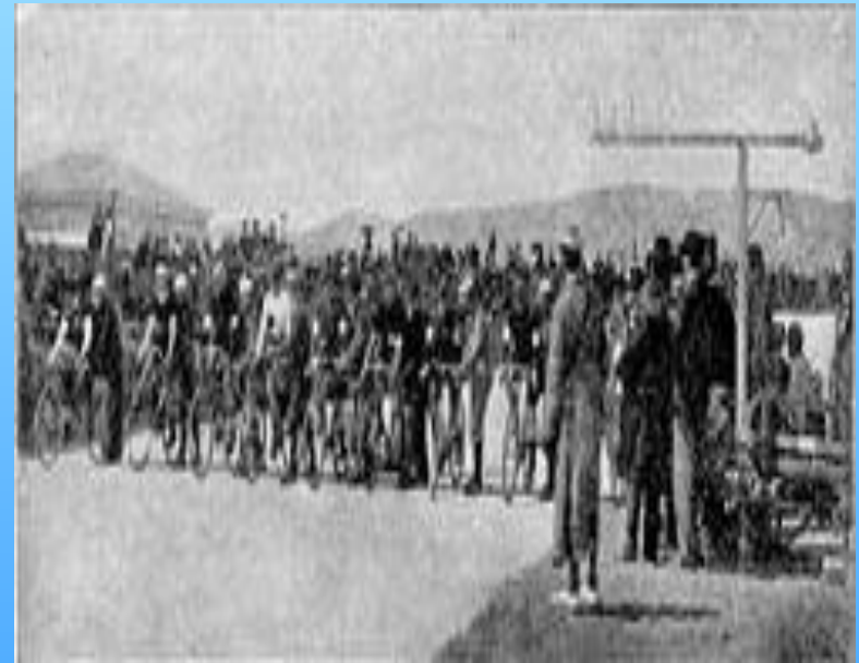
Старт шоссейной гонки

Трековые гонки прошли на велодроме «Нео Фалирон».