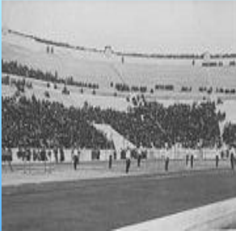
Немецкая команда во время командных упражнений на перекладине