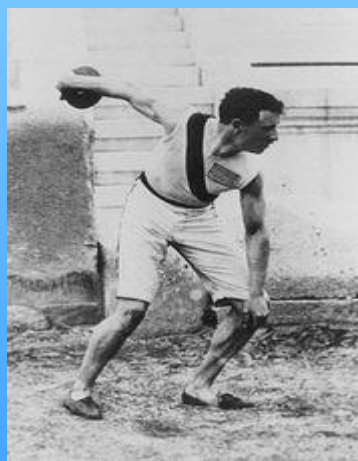
Роберт Гаррет во время метания диска