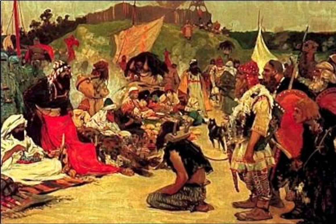
С.Иванов. Торг в стане восточных славян

Славяне заселяли территории финно-угров и балтов мирным путем. Такое освоение приводило к смешению их с местными племенами и вело к добрососедским отношениям, основанным на взаимовлиянии.