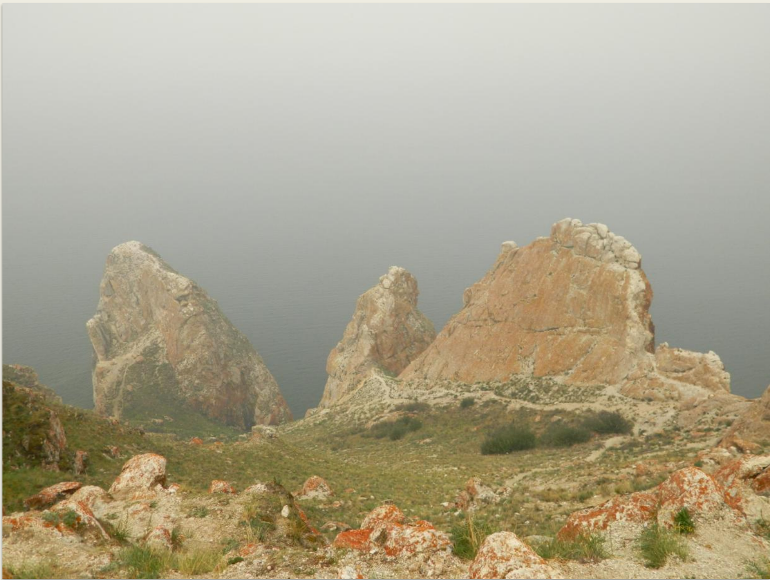
Мыс Саган –Хушун (Белый мыс). Скала Три брата