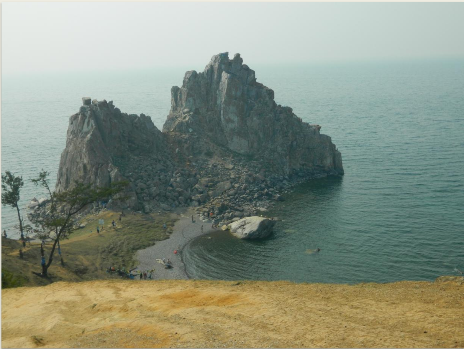
Мыс БУРХАН- одна из 9 главных святынь Азии