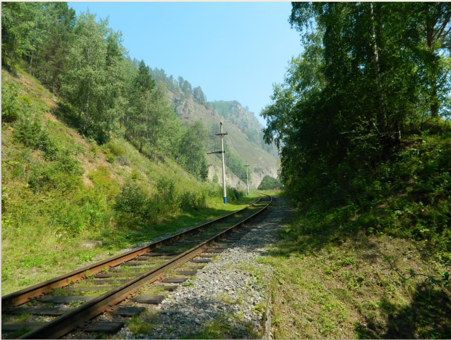
Кругбайкальская железная дорога (КБЖД)