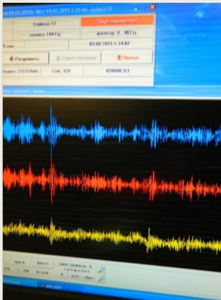
Показания сейсмодатчиков можно видеть на экране в режиме реального времени