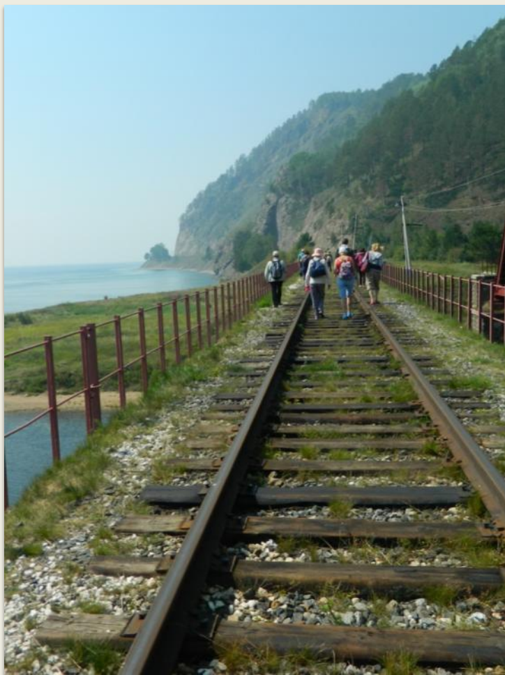
Мост на КБЖД