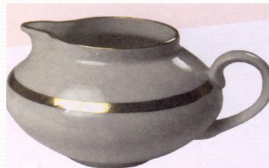
● С МОЛОКОМ