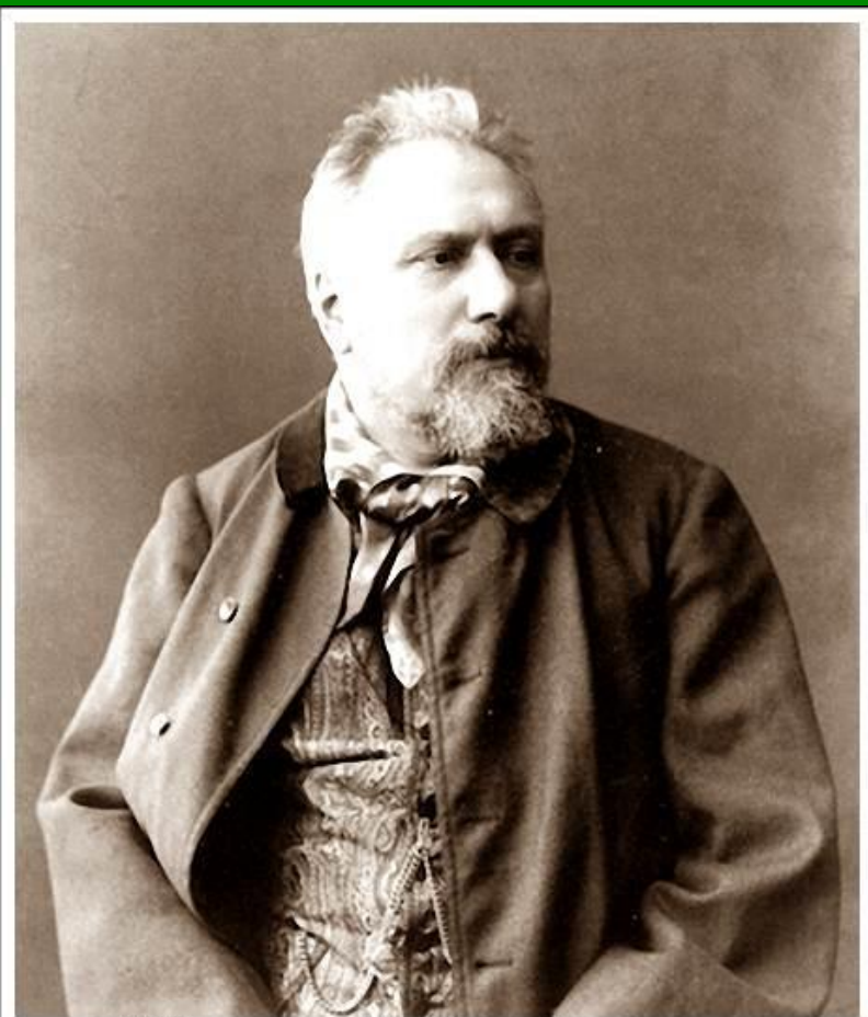
Николай Семёнович Лесков