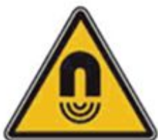
354 Внимание. Магнитное поле