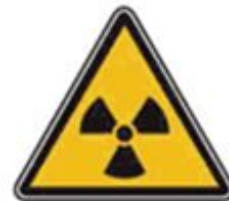
346 Опасно. Радиоактивные вещества или ионизирующее излучение