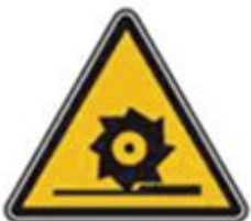
362 Осторожно. Режущие валы