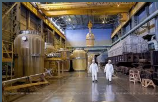
предприятия по переработке или изготовлению ядерного топлива