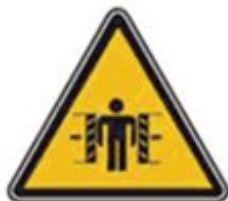
363 Внимание. Опасность зажима