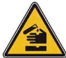
345 Опасно. Едкие и коррозионные вещества