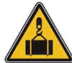
347 Опасно. Возможно падение груза