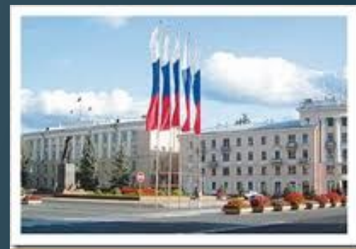
научно- исследовательские и проектные организации