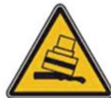
364 Осторожно. Возможность опрокидывания