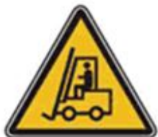
348 Внимание. Автопогрузчик