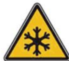
358 Осторожно. Холод