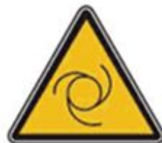
365 Внимание. Автоматическое включение (запуск) оборудования