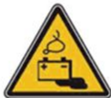
361 Осторожно. Аккумуляторные батареи