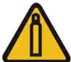
360 Газовый балон