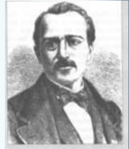
Август Отто (1832-1891)