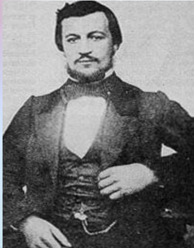
Этьен Ленуар (1822-1900)