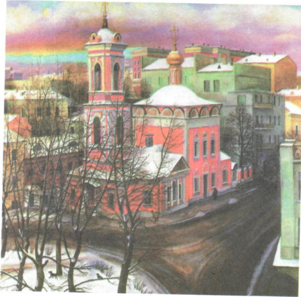
Т. Назаренко «Церковь Вознесения на улице Неждановой»