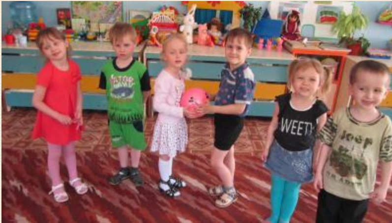
«Корзина добрых дел»