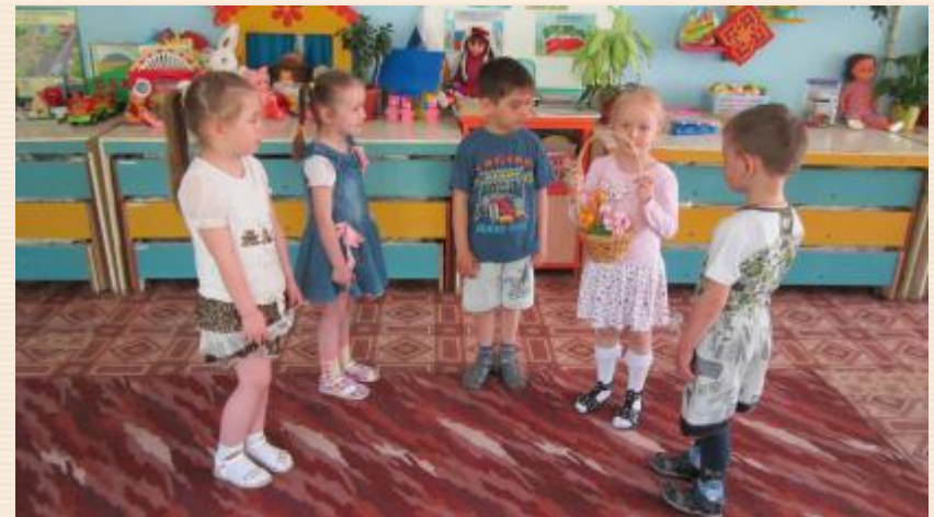
«Кому что нужно для работы»