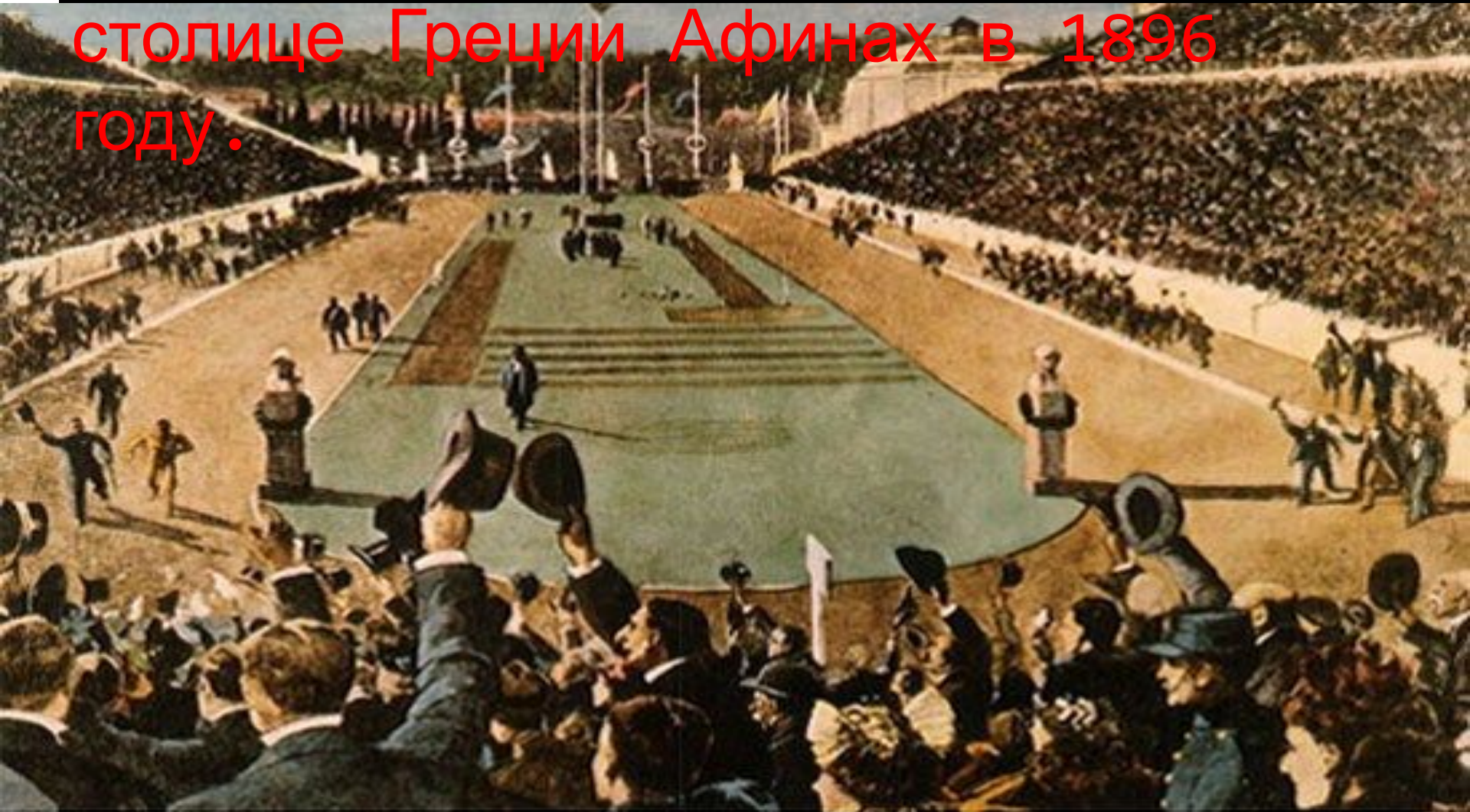
Финиш победителя марафона и приветствие зрителей на I Олимпийских играх 1896 года

Первые Олимпийские игры современности решено было провести на их родине – в столице Греции Афинах в 1896 году.