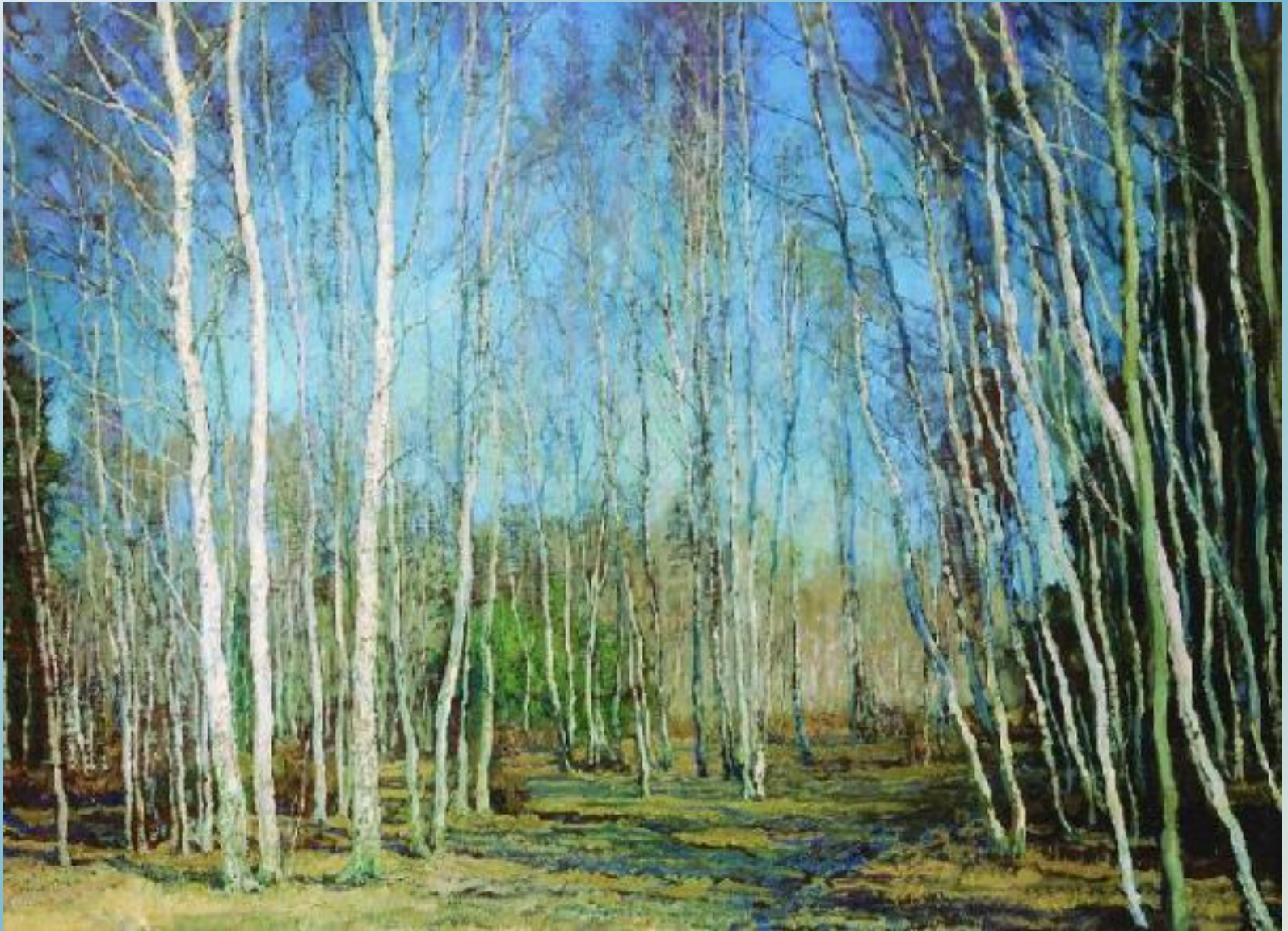
Бакшеев Н.В. Голубая весна.