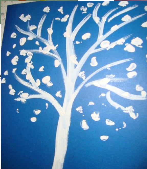
Дерево в снегу