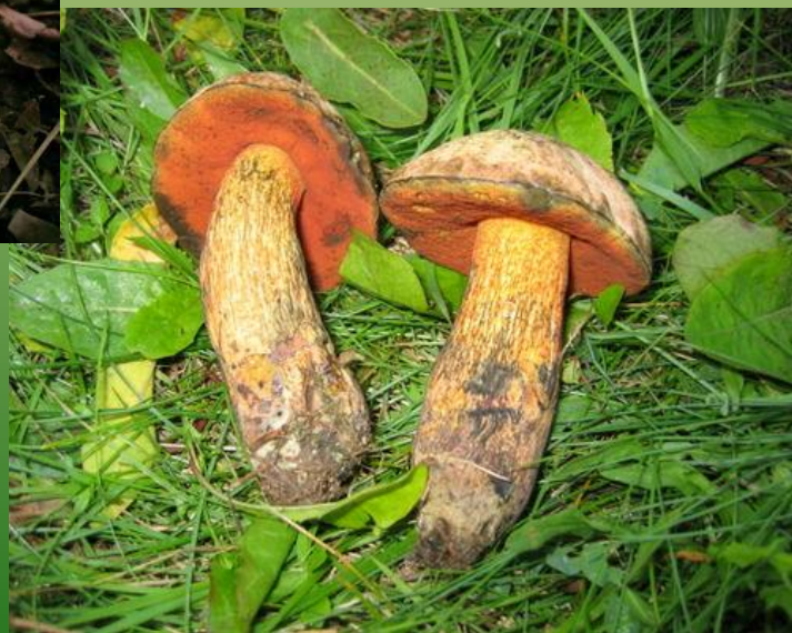
ГРИБЫ НОВОРОССИЙСКА