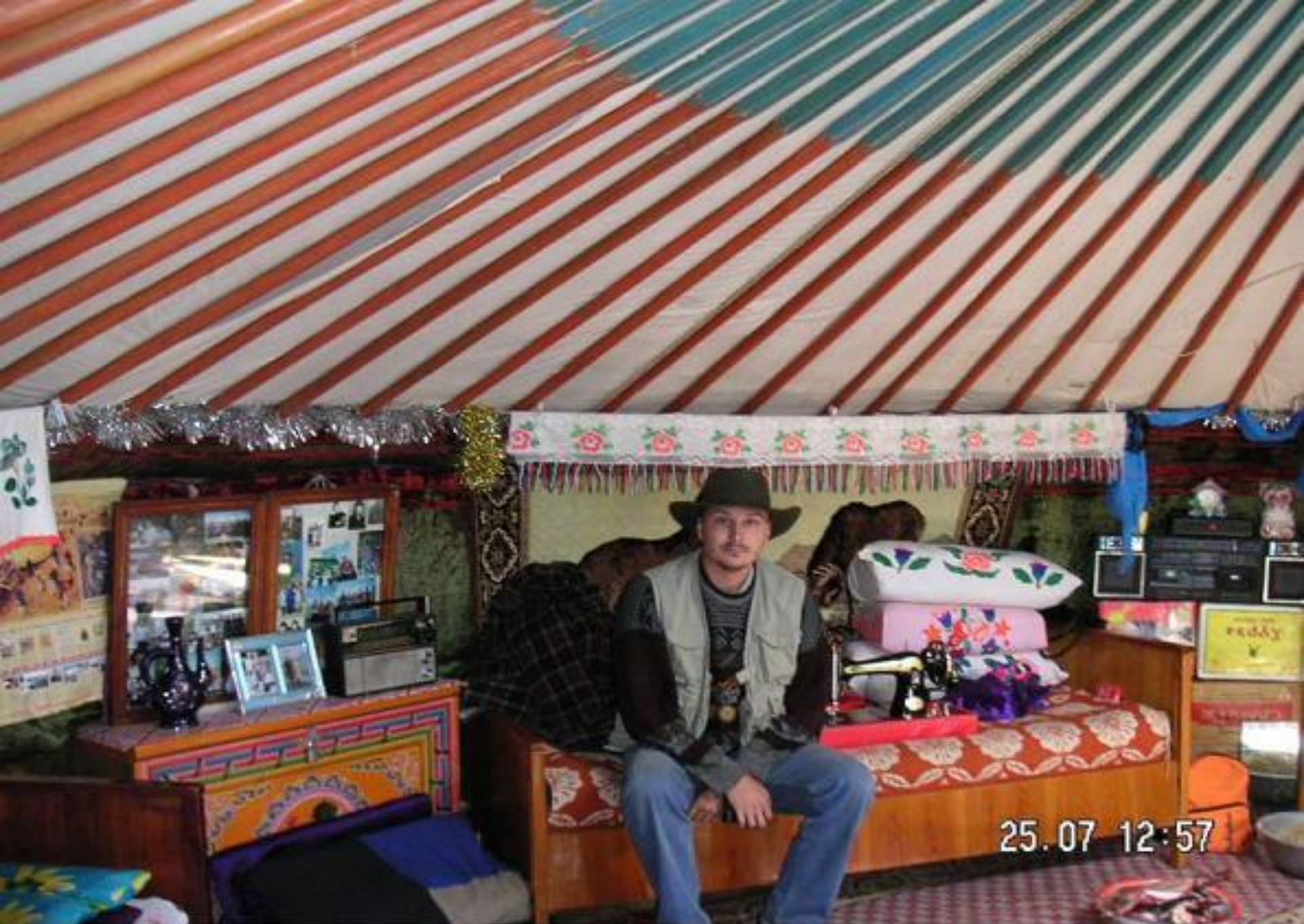
Интерьер монгольской юрты.