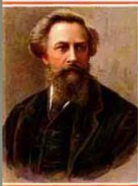
▶ А.К. Толстой