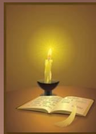
Смотреть на горящую свечу